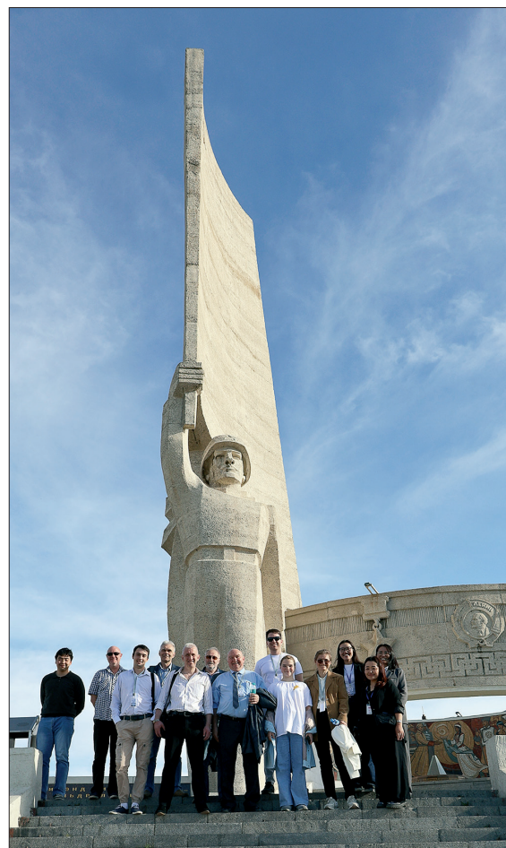
У памятника советским воинам на горе Зайсан

Визит в Монголию произвел яркое впечатление на всех членов делегации ОИЯИ. Аэропорт Улан-Батора встретил нас поднят национальным флагом Монголии. Доброжелательность и спокойствие людей, чистота на улицах Улан-Батора, смешение современных и традиционных одежд, музыки, декораций, множество молодежи и детей вокруг, несчетное число строящихся зданий и круглые белые юрты между ними — всё это современный Улан-Батор. Население Монголии невелико, около 3,5 млн человек, из