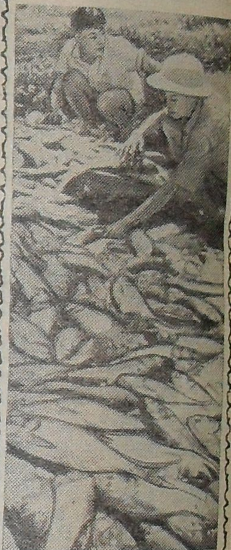
ДЕМОКРАТИЧЕСКАЯ РЕСПУБЛИКА ВЬЕТНАМ. Рыболовецкий кооператив «Октябрь», расположенный в предместьях г. Хунг Ен, — один из передовых. В этом сезоне рыбаки наметают удвоить улов по сравнению с прошлым годом. За одно притонение члены коллектива вылавливают до трех тонн рыбы.

На снимке: рыбаки кооператива «Октябрь» за работой.