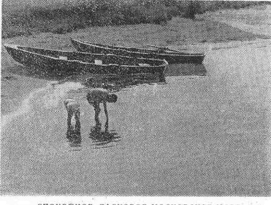
СПОКОЙНОЕ, ЛАСКОВОЕ МОСКОВСКОЕ МОРЕ

Нужно отметить, что четко пужно отметить, что четко работала судейская коллегия и много удовольствия зрителям интересными комментариими соревнований доставил судья-информатор Борис Шведов. О. ЗАМАРАЕВА.